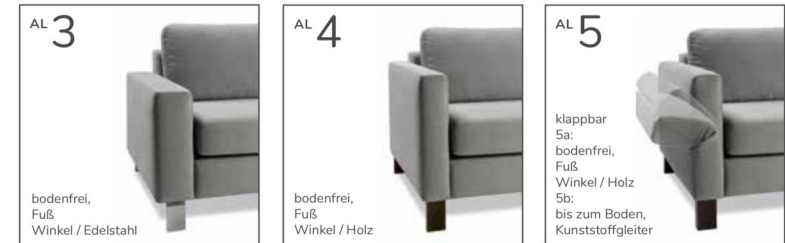
bodenfrei, Fuß Winkel / Edelstahl

Alle Füße und Kufen lassen sich mit den folgenden Armlehnen kombinieren.