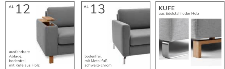
ausfahrbare Ablage, bodenfrei, mit Kufe aus Holz