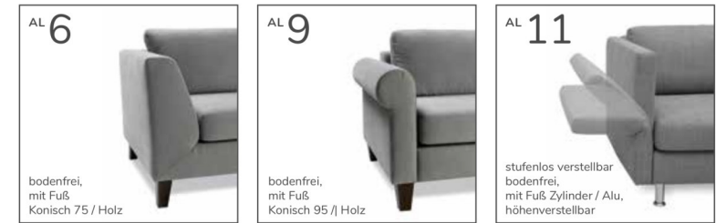
bodenfrei, mit Fuß Konisch 75 / Holz