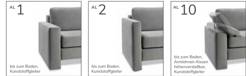
bis zum Boden, Kunststoffgleiter