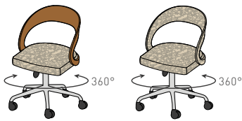
GFK PH R